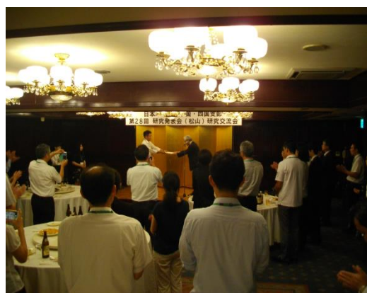
研究交流会（発表賞表彰）